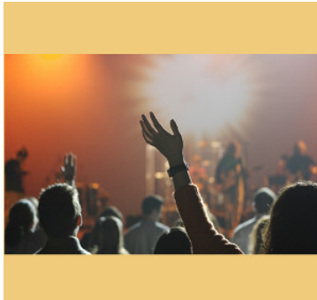
Teatro Filarmonico 5 febbraio 2018, ore 21.00

Lo storico gruppo italiano dei Nomadi in un esclusivo concerto al Teatro Filarmonico per presentare il nuovo album Nomadi Dentro . I Nomadi canteranno dal vivo anche alcuni dei numerosissimi e celeberrimi successi che in più di cinquant'anni di carriera li hanno fatti entrare nel cuore del pubblico. L'amore e i sentimenti sono da sempre accompagnati, nei testi delle loro canzoni, da un forte messaggio di denuncia e impegno sociale, seppur mai troppo politicizzato, che essi sin dagli inizi non si stancano di trasmettere in tutto il mondo, vivendo in una sorta di tour perenne.